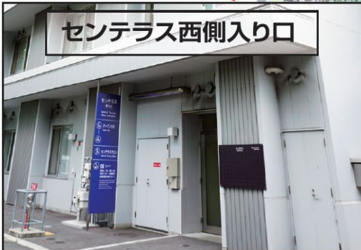
センテラス西側入り口